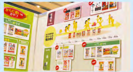
※写真は2017年度の様子です。参加店舗・ブースは年度によって異なります。